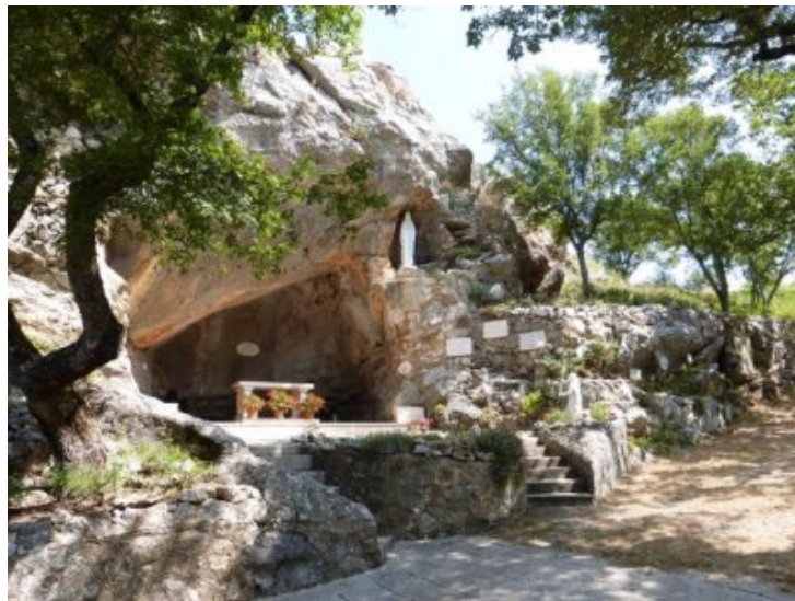
La grotte de Lourdes