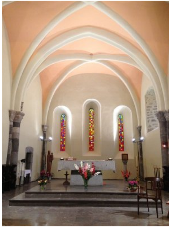
choeur de l'église après sa restauration

L'enjeu de cette église était de prendre en compte les éléments hétéroclites qui la constituaient (choeur roman, vitraux moderne très colorés, nef gigantesque)