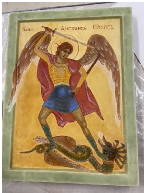
Icône du groupe de Fontenay

Le combat contre satan représente tout ce qui nous sépare de Dieu.