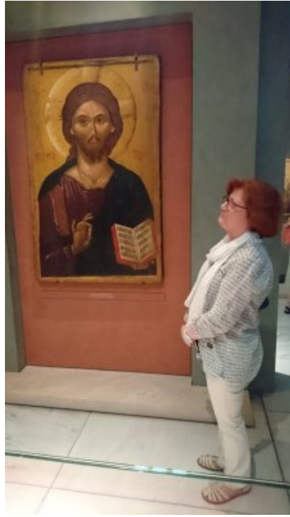
musée archéologique de Thessalonique

Nous prenons conscience, chaque fois lors de nos déplacements dans les pays orthodoxes, que la véritable iconographie ne peut se transmettre dans les livres et qu'il faut vivre une réelle expérience vivante contemplative.