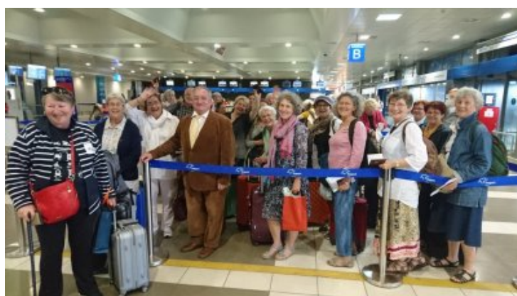
un groupe qui revient enchanté