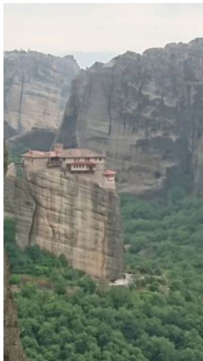
monastère des météores

Ceci est le véritable sens de l'orthodoxie.