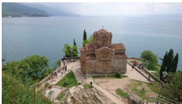
églises merveilleuses d'Ohrid