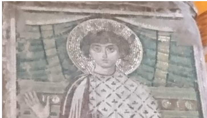
St Dimitri de Thessalonique