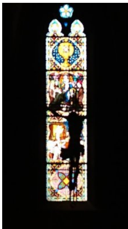
le Corps du Christ est comme une chrysalide vidée de la mort qui nous permet de participer à la Divinité

Le groupe composé de personnes issues de diverses origines (russe, vietnamienne, hongroise, slovaque, japonaise, française, allemande ...) a travaillé de manière assidue pendant 4 jours. Le temps de travail était entrecoupé par les offices de la communauté des soeurs bénédictines de Rosheim qui nous accueillait.