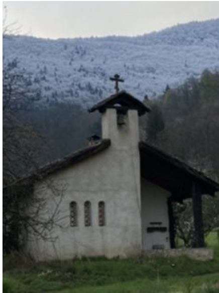
Notre chapelle de la Dormition

Le Christ arrive en ce monde dans une crèche d' »animaux sans raison » selon les Évangiles.