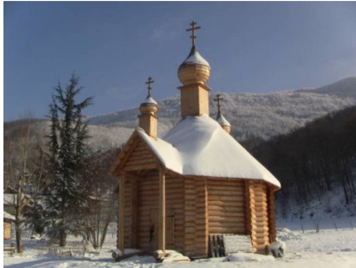
Chapelle de tous les Saints (Vercors)

La fête de la Nativité approche et nous serons heureux de nous retrouver à cette occasion pour célébrer cet événement majestueux.