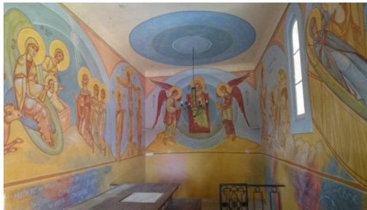
Fresque de la chapelle d'Ollioules réalisées en 2016

Il ne faut pourtant pas oublier que l'Incarnation est la porte ouverte à la Transfiguration et non à l'Humanisme. Fêter Noël, c'est avant tout recevoir l'annonce que le Royaume de Dieu n'est pas de ce monde et qu'il est temps de se transformer.